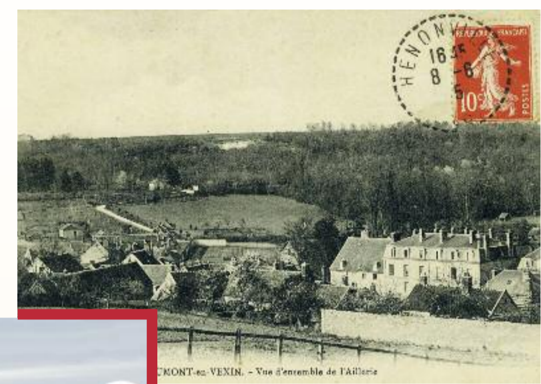
Vue générale sur l'Aillerie