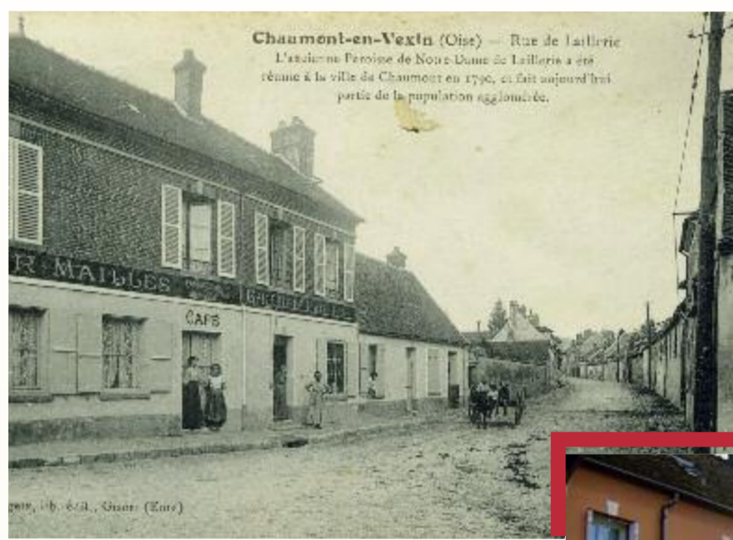
Rue de L'Aillerie

Rue de Lailerie ou de L'Aillerie Deux étymologies : • Un lieu planté d'ail • un lieu humide et marécageux Si la seconde origine semble la plus probable, il faut noter que les vertus médicinales de l'ail étaient connues depuis l'Antiquité et très appréciées au Moyen-Age . Ainsi Charlemagne avait exigé que l'ail soit semé dans tous ses jardins et l'on trouvait l'ail dans tous les jardins des monastères.