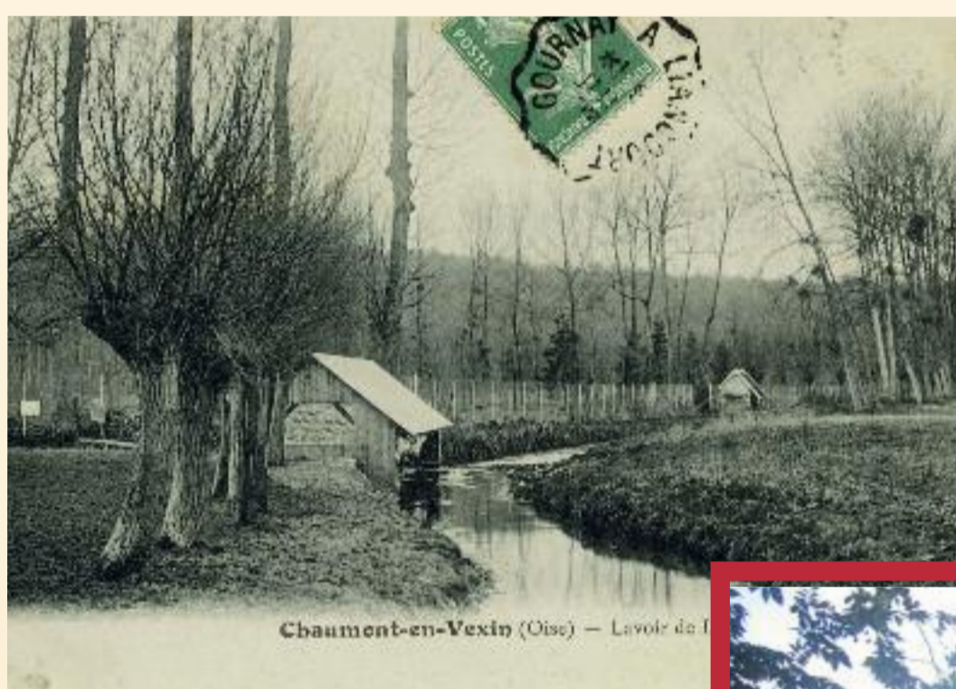
Lavoir de L'Aillerie Impasse du Rousselet